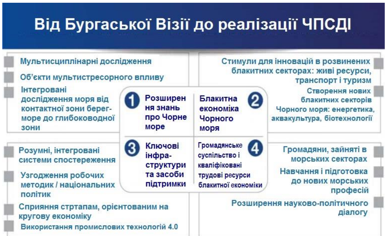
Рисунок 4 Цілі СПДІЧМ, що базуються на Бургаській Візії

Після запуску Бургаської Візії у травні 2018 року зусилля «Ініціативи блакитного зростання Чорного моря» були зосереджені на розробці цілей і завдань СПДІЧМ. Для того, щоб відкрити шлях до реального і ефективного впровадження СПДІЧМ, була розроблена структура СПДІЧМ, яка містить чітке визначення цілей, завдань і основних виконавців (Рисунок 4).