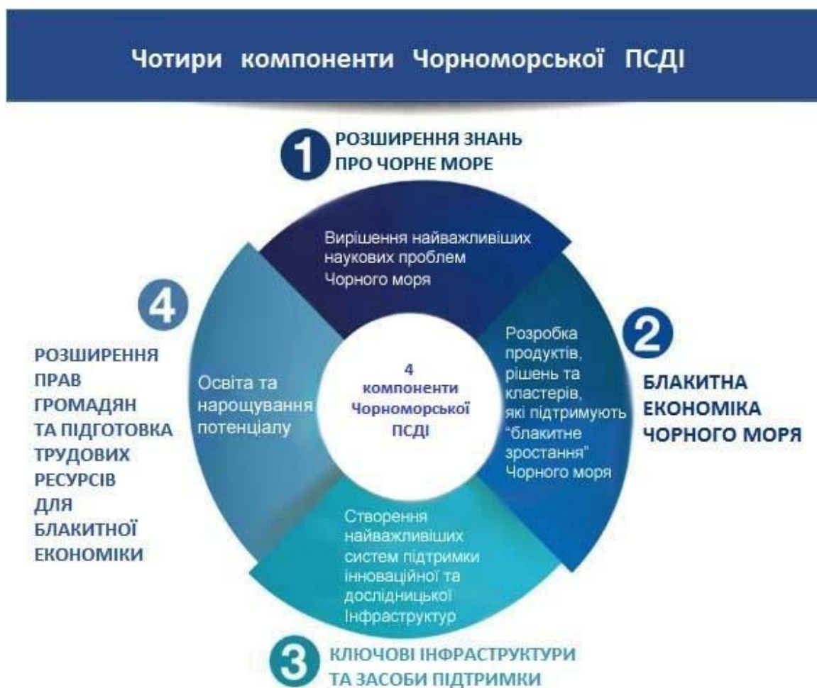
Рисунок 1 - Чотири основних компоненти СПДІЧМ, заснованої на Бургаській Візії