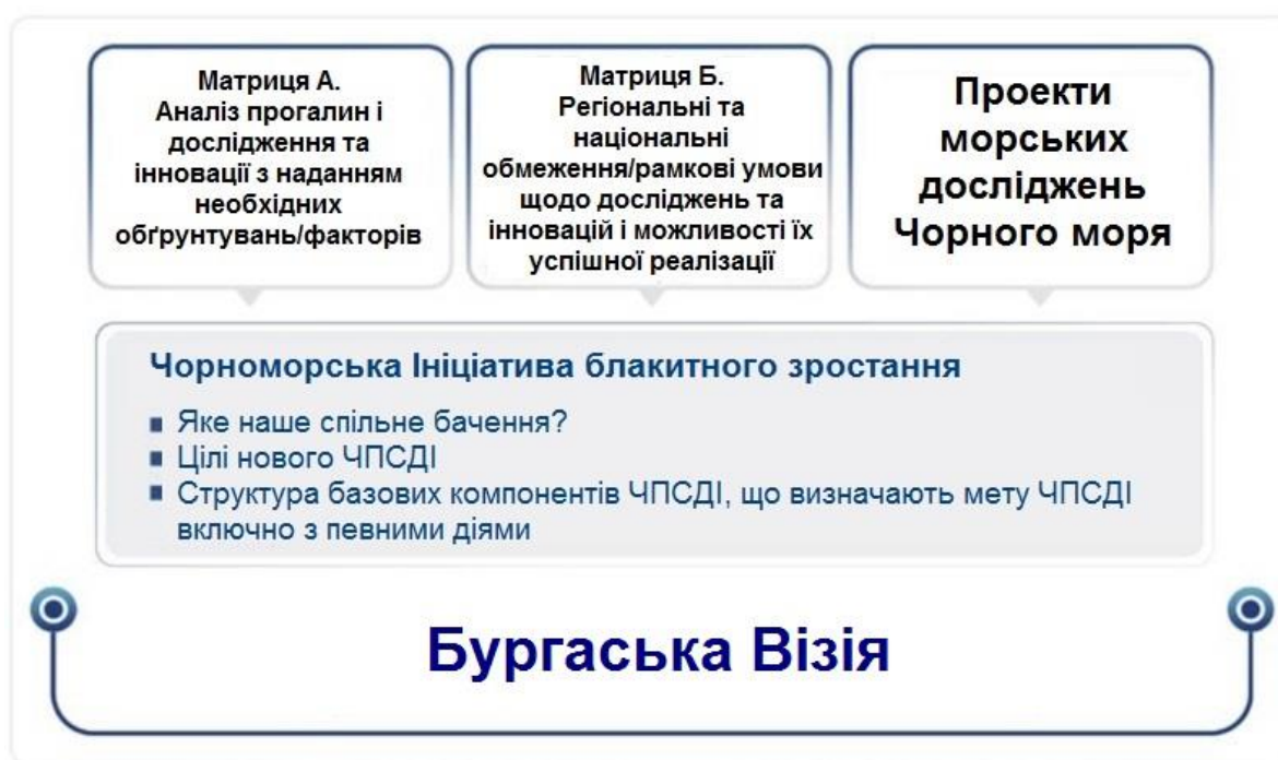
Рисунок 2 Кроки, що привели до створення Бургаської Візії

За підтримки Європейської комісії (ЕК) і за участі експертів, що приєдналися до ініціативи «Блакитне зростання для досліджень та інновацій у Чорному морі», було проведено вісім семінарів (Рисунок 2). Насамперед була зібрана й проаналізована інформація про національні й міжнародні морські дослідницькі проекти. По-друге, були зіставлені пробіли інформації та знань і можливості для досліджень та інновацій з необхідним обґрунтуванням і визначені можливі учасники СПДІЧМ від кожної чорноморської країни. По-третє, були визначені регіональні й національні граничні й рамкові умови у сфері досліджень та інновацій та потенціали (наукові, технічні, фінансові) для успішного виконання СПДІЧМ. На основі зібраної інформації і результатів цих семінарів експерти Ініціативи розробили загальне бачення, цілі та завдання СПДІЧМ, які були представлені в Бургаській Візії.